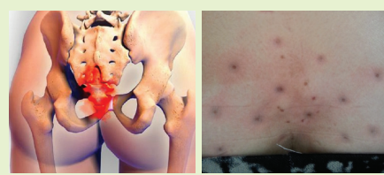
꼬리뼈가 상한 분은 검은 독소가 터져 나온다.

2. 변실금도 항문 및 꼬리뼈의 독소를 없애줘야 합니다. 삽입형을 쓰면 대개 1~3달 이면 조여지게 됩니다. 그래도 잘 안되는 분은 꼬리뼈 속의 독소를 뽑아줘야 합니다. 심한 분은 검은 독소가 나옵니다.