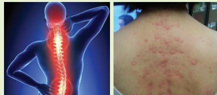
뼈 독소제거로 불면증, 이명, 두통이 동시에 사라진다.

2. 불면증은 등판의 독소를 먼저 없애고 두개골의 독소를 없애면 해방됩니다. 대개 잠이 안오면 두개골의 문제로만 생각을 하는데 사실은 막힌 등판을 열어 에너지가 꼬리뼈부터 두개골까지