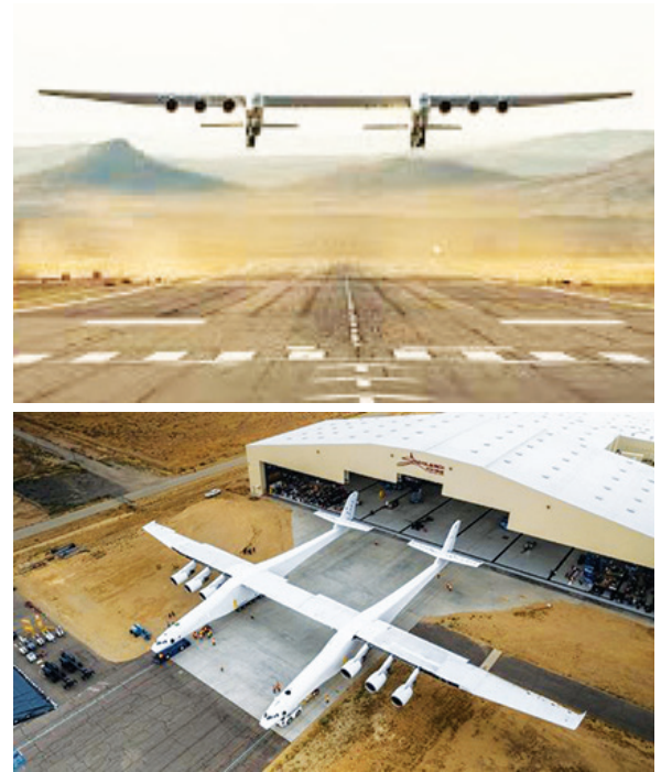
▲ 지난 13일 지난 13일 캘리포니아의 모하비 공항·우주항에서 민간 우주개발업체 스트레토론치 시스템즈가 개발한 세계 최대 크기의 제트기 스트레토가 성공적인 첫 시험비행을 마쳤다.

스트레토론치 시스템즈는 마이크로소프트의 공동 설립자인 폴 앨런이 2011년 설립한 회사다. 앨런은 스트레토의 첫 비행을 보지 못한 채 지난해 10월 숨졌다.