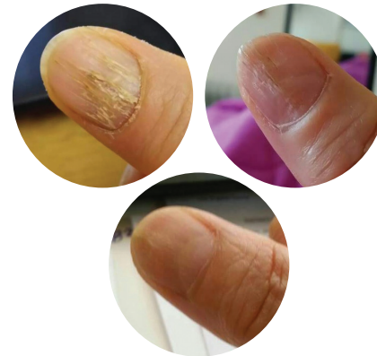
손톱이 심하게 상한 분이 미라클터치를 통해 6개월만에 회복이 된 모습. 이렇게 뼈가 좋아지면 관절의 염증도 사라진다.

3. 발목, 발바닥, 발뒤꿈치 통증도 먼저 고관절을 다스려줘야 합니다. 발톱무좀도 마찬가지로. 엄마 역할을 하는 고관절이 썩게 되면 에너지가 아래로 흐르지 못해 발병이 생기는 것입니다. 대략 7개월 정도 소요됩니다.