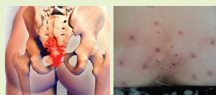
꼬리뼈가 상한 분은 검은 독소가 터져 나온다.

2. 변실금도 항문 및 꼬리뼈의 독소를 없애줘야 합니다. 삽입형을 쓰면 대개 1~3달 이면 조여지게 됩니다. 그래도 잘 안되는 분은 꼬리뼈 속의 독소를 뽑아줘야 합니다. 심한 분은 검은 독소가 나옵니다.