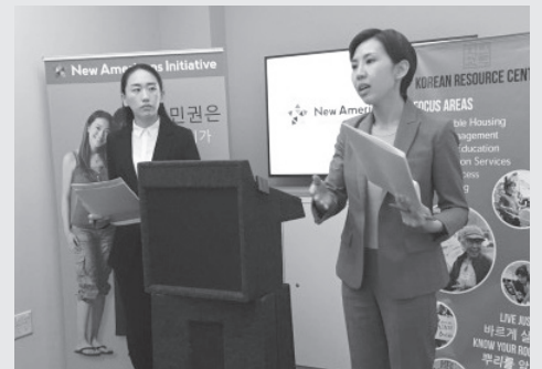
▲ 지난 10일 민권단체 민족학교 관계자들이 오는 20일 열릴 무료 시민권 신청 워크숍에 대해 설명을 하고 있다.