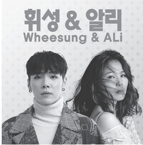
대표곡으로는 '365일', '흔스럽게 굴지마', '뭘 이렇게 다 있어' 등이 있다.

2003년 리쌍의 '내가 웃는 게 아니야' 피쳐링을 통해 데뷔한 그녀는, 2011년 불후의 명곡에 출연하면서 폭발적인 가창력과 감성으로 대중들에게 큰 인기를 얻었다. 싱어송 라이터 실력과인 그녀는 실용음악과 교수로서 학생들을 가르치기도 했다.