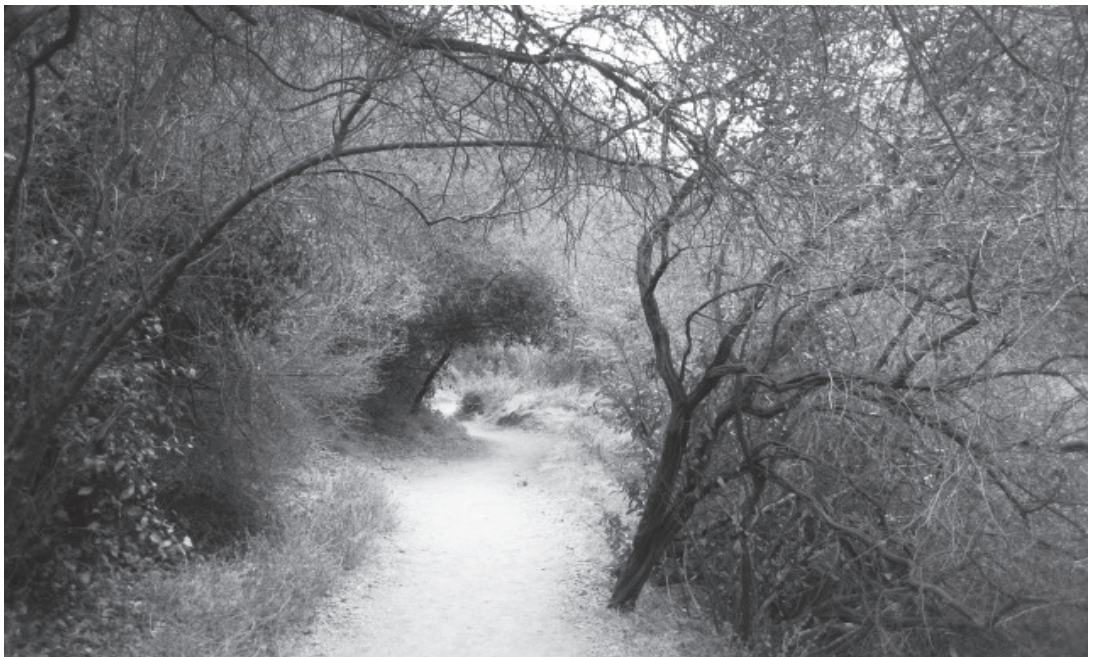
▲ 테메스컬 캐년 트레일은 수풀이 무성하다.