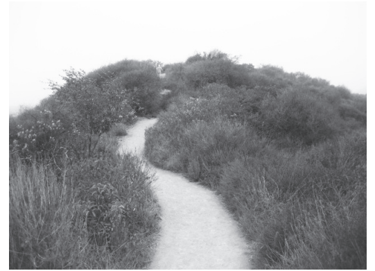
▲ 나무 그늘이 없는 이 길을 걸어 내려와야 한다.

바다에서 불과 1마일 정도 거리에 있는 테메스컬 캐년은 수풀이 무성하다. 트레일 헤드(주차장)에서 산을 향해 잠시 올라가면 Temescal Canyon Retreat Center가 있다. 그 수양관을 지나면서 두 갈래 길이 나온다. 원을 그리면서 한 바퀴 돌아 나오는 등산로이기 때문에 어느 쪽으로 오르던 상관없지만 오른쪽 길을 택한다. 약 1.3마일 지점에 폭포가 있는 계곡이 나오고 작은 다리가 나온다. 다리를 건너 폭포에서 0.4마일 정도 지점에 이르면 또 두 갈래 길이 나온다. 오른쪽 길(Bienvenido)은 약간 오르막길로 2.3마일 가량의 Trail이 계속 되고 왼쪽은(Sunset Blvd) 1.8마일인데 내리막이다. 왼편을 택한다. 햇살이 강하게 내리쬐는 산등성을 잠시 걸어야 한다.