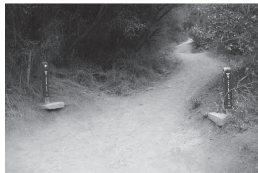
▲ 갈림길에서 왼쪽 길을 택한다.

■ 가는 길: 오렌지카운티에서 5번 North를 타고 가다가 10번 West로 갈아타고 10번이 끝나면서 Pacific Coast Highway와 만난다. PCH North로 잠시 가다가 Temescal Canyon Rd.를 만나 우회전에서 길 따라 잠시 올라가면 주차장이 나온다.