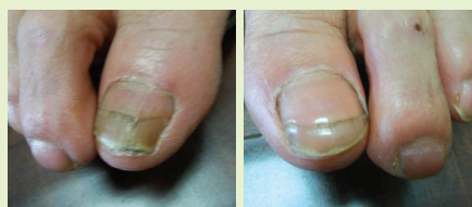
뼈 독소를 없애주자 옛 발톱이 사라지고 새 발톱이 나옴.

2. 발바닥과 발뒤꿈치 통증환자나 발가락이 구부러지는 분도 무좀 환자와 같습니다. 원인제거를 하려면 반드시 항문과 골반에