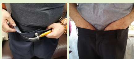
변독을 없애면 배설이 쏙 빠지고 배가 따뜻해진다.