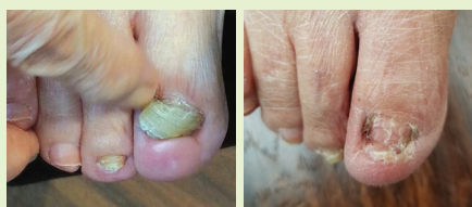
심한 무좀환자가 7개월만에 새 발톱으로 완전히 바뀐 모습.