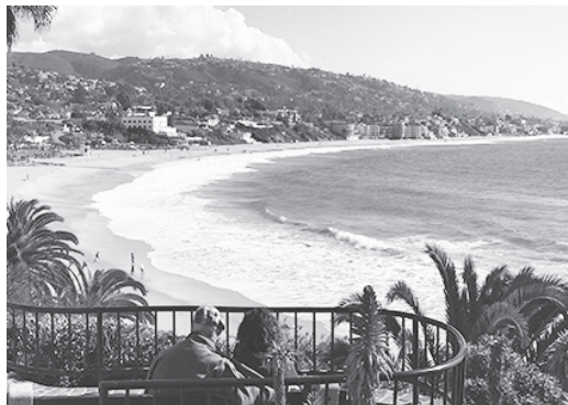
▲ 라구나비치 전경

제일 먼저 추천하고 싶은 해변은 라구나비치(Laguna Beach)이다. 필자가 이곳을 찾을 때는 Urth Cafe에서 식사부터 한다. 이 식당은 언제나 밖으로 길게 줄이 늘어서 있다. 줄에 서서 밖에 구비되어 있는 메뉴판을 보면서 무엇을 먹을 것인가 고른다. 그날그날 먹고 싶은 것을 다르게 하는 편인데 거의 대부분 크게 만족하며 먹을 수 있었다. 특히 커피가 맛있다고 정평이 나있으니 커피를 시켜도 좋겠다. 식사를 마치고 식당에서 나와 Pacific Hwy를 따라 남쪽으로 향하는 비탈길을 내려가면 Laguna Main Beach로 갈 수 있으나 차들이 썩썩 달리는 길가를 걷기 보다는 태평양을 바라다보면서 걷는 편이 운치 있고 더 멋있지 않은가. 횡단보도를 건너 Cliff Drive 길을 따라 걷는다. 몇 걸음 옮기지 않아 Las Brisas라는 커다란 식당을 만난다. 그 식당 앞으로 난 길을 따라 걸으면서 보면 라구나 메인 비치가 정면에서 멋진 풍경으로 다가 온다. 오른쪽은 광활한 태평양이 펼쳐져 있다. 사진기만 들이대면 모든 것이 작품사진이 된다. 날씨와 관계없다. 영광도 문제없다. 샷터만 누르면 작품이다.