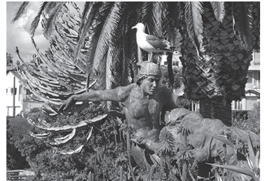
▲ Cliff Dr. 길이나 그 아래 산책로를 걷다 보면 이런 작품들을 종종 만나게 된다.

Las Brisas 식당 앞에는 정자가 있다. 이곳이 라구나 선셋뷰우포인트이다. 역시 전망대답게 어느 방향을 향해 서서 사진을 찍어도 아름다운 작품을 얻을 수 있다. 거기서 조금 걷다 보면 Heisler Park Beach Stairway를 지나고 Papou's Beach가 나온다. Diver's Cove까지 걷다가 오던 길을 되돌아와도 좋고 시간이 넉넉하면 Pacific Hwy로 나와 길을 건넌다. 그러면 갤러리들이 몇 군데 있다. 그곳에 들어가 그림을 감상하고 작가들과 대화하는 여유를 가져도 좋다. 마음에 드는 그림이 있으면 한 점 구입해도 괜찮다. 필자는 가격이 비싸지 않은 기념이 될 만한 작품을 사서 함께 간 친구들에게 선물하기도 했다. 갤러리 한 군데 한 군데 들릴 때마다 그 갤러리들의 특성이 발견되기도 하고 전시된 작품들을 보면서 작가가 그 작품을 통해서 무엇을 얘기하려고 한 것인가를 찾아보기도 한다.