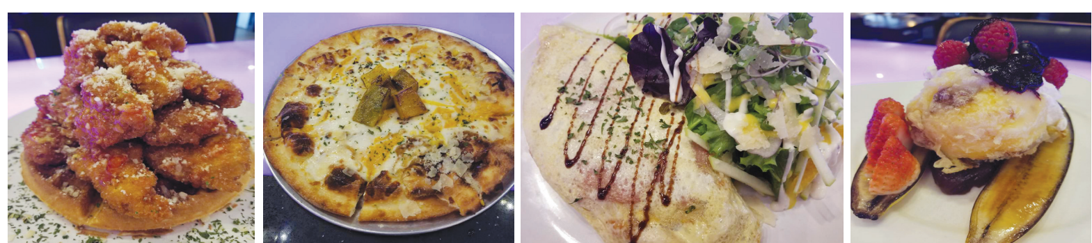
허니버터 팝콘치킨와플 단호박 피자 김치볶음밥 오무라이스 덴뿌라 아이스크림

Lunch 식사 + Coffee Free / 와인(병) 오더시 치즈안주 Free