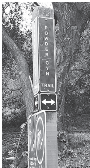
▲ 길 안내 표지판이 잘 되어 있다.

숲길이 있기는 하지만 대부분 땀별에 몸을 노출하고 걸어야 한다. 반드시 모자를 쓰고 선글라스를 착용하고 햇빛 차단제를 바를 것을 권한다.