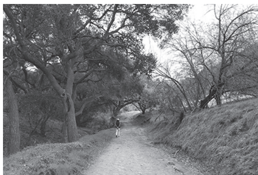
▲ 커다란 나무가 그늘을 만들어준다.

Schabarum park까지 갔다가 되돌아오는데 약 4마일로 1시간 30여분에서 아무리 천천히 걸어도 2시간 정도 걸린다. 만일 이 코스가 짧다고 느껴지면 얼마든지 더 걸을 수 있다. 많은 코스들이 있으니 오다가 다른 길을 택해 잠시 걸어도 좋다.