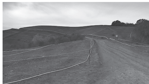
▲ 트레일에는 목목을 심어놓은 구간도 있다. 10년 후쯤이면 제법 자란 나무들이 반겨줄 것이다

오렌지카운티에서는 Harbor Blvd.를 타고 북상하다가 Pathfinder Rd.에서 유턴해서 조금 올라오면 Fullerton Rd.를 만난다.