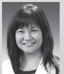
Dr. 백사론 한의원, 척추신경의사 SCU 척추 의대 졸업 (1992) South Baylo 한의대 졸업 (2012)

9681 Garden Grove Bl., Suite 101 Garden Grove, CA 92844(모란각 식당 옆)