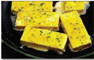
6. 달군 팬에 식용유를 두르고 달걀옷을 입힌 두부를 넣고 앞뒤로 노릇하게 부쳐주면 끝.

백세건강지킴이 세리토스, 다우니, 롱비치, 실비치 지역등 노약사에게 전화주세요.