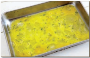
4. 달걀, 소금, 파슬리가루를 한데 넣고 골고루 잘 섞는다.