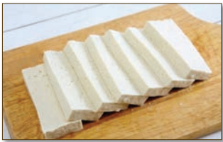
1. 두부는 길이대로 1.2cm간격으로 썰고, 키친타월에 올려 물기를 어느 정도 건어낸다.