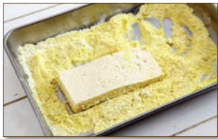
3. 물기를 어느 정도 뺀 두부에 한데 섞은 부침가루, 카레가루를 앞뒤로 골고루 입힌다.