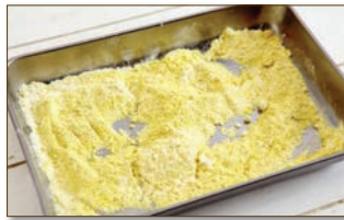
2. 오목하고 넓은 그릇에 부침가루, 카레가루를 한데 섞는다.