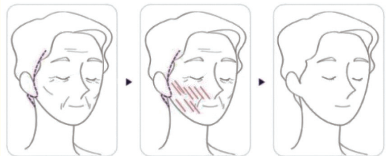
시술 전 탄력없는 피부 팔자주름, 불살처짐, 피부처짐 등 부위에 실리프팅 삽입 시술직후 - 한달까지 리프팅 효과