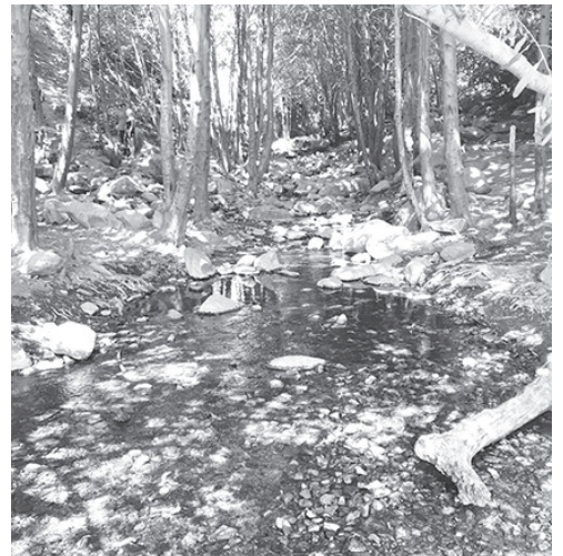
▲ 폭포를 향해 오르다 보면 시원한 물줄기를 만날 수 있다.