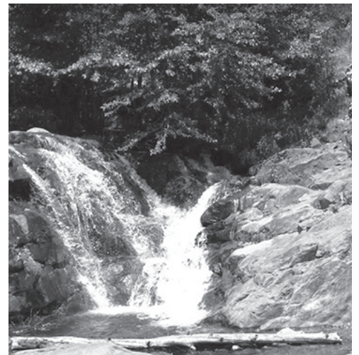
▲ Etiwanda 폭포, 녹음과 어우러져 청량감이 전해진다.