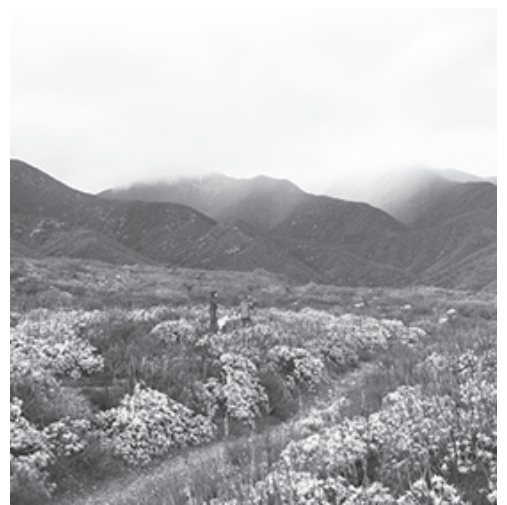
▲ 트레일 초입부 좌우에 야생화가 만발해 있다.

▶ 관리부서: San Bernardino County Parks and Recreation