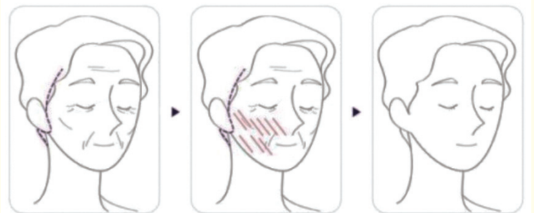
시술 전 탄력없는 피부 팔자주름, 불살처짐, 피부처짐 등 부위에 실리프팅 삽입 시술직후 - 한달까지 리프팅 효과