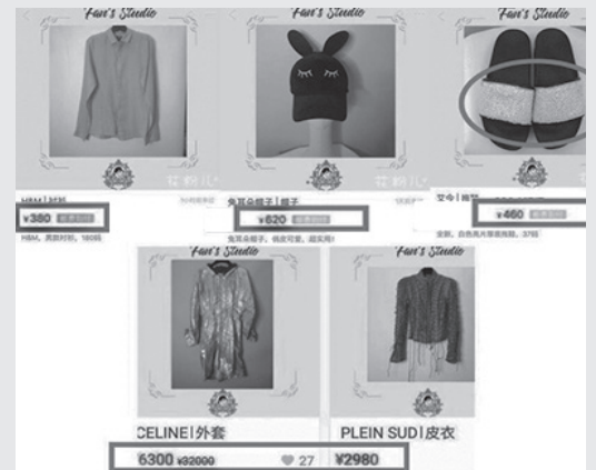
▲ 중고거래 사이트에서 판매 중인 판빙빙의 물건들.

탈세 혐의로 곤욕을 치른 배우 판빙빙이 자신의 옷을 중고 거래 사이트에 올리며 근황을 전했다.