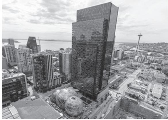
▲ 시애틀 아마존 본사 전경

발표를 앞두고 일부 부동산업자들은 편리한 교통, 다양한 인적자원, 친기업 환경 등을 분석해 아마존 제2본사가 자리 잡을 곳에 미리 투자하고 있다. 미국 부동산 시장이 둔화 조짐을 보이는 가운데 유력 후보지로 꼽히는 10곳은 지난 7월 기준 집값이 1년 전보다 7% 가까이 올랐다. 특히 보스턴시의 서포크 카운티는 14% 상승했는데 전년도의 상승률은 1%에 불과했다.