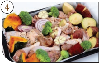
4. 오븐 팬에 종이호일을 깔고 양념한 닭고기를 올린 후, 군데군데 준비된 채소를 함께 담고 올리브오일을 전체적으로 골고루 지그재그 뿌린다.