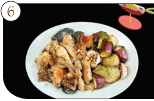
6. 완성 그릇에 담아 주면 보기도 좋고 맛도 있는 닭한마리오븐구이 완성.