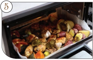
5. 200도로 예열한 오븐에 넣어 30~40분간 굽고, 온도를 180도로 낮춰 중간중간 상태를 확인하면서 다시 10~20분 정도 더 구워주면 끝.