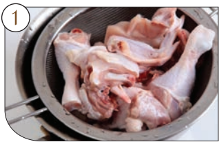
1. 볶음탕용 닭 한마리를 찬물에 여러번 헹구고, 큰기름을 떼어 내서 물기를 빼서 준비한다.

◆ 주재료: 닭 볶음탕용(1마리), 허브맛소금(1), 올리브유(2+3), 고구마, 감자, 단호박, 브로콜리, 양파, 통마늘 등의 재료(적당량)