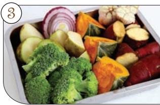
3. 절이는 동안 함께 넣을 재료인 고구마, 감자, 단호박, 브로콜리, 양파, 통마늘을 큼직하게 썰어서 같이 구울 수 있게 자른다.