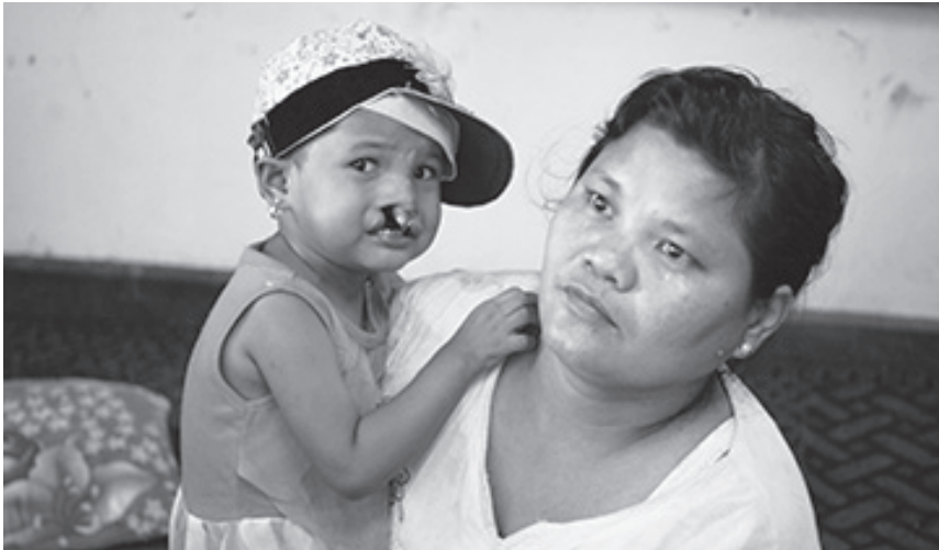
▲구순구개열 수술을 기다리고 있는 5살된 미얀마 어린이와 엄마(왼쪽). 수술 직전 어린이의 얼굴 모습(오른쪽 원 안)과 수술을 마친 직후 어린이의 얼굴