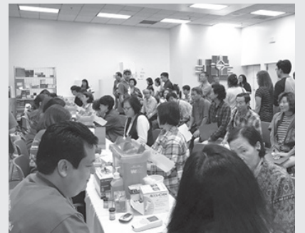
▲ 작년 10월 굿사마리탄 병원에서 열린 한인 무료 건강박람회에서 한인들이 상담 받는 모습.