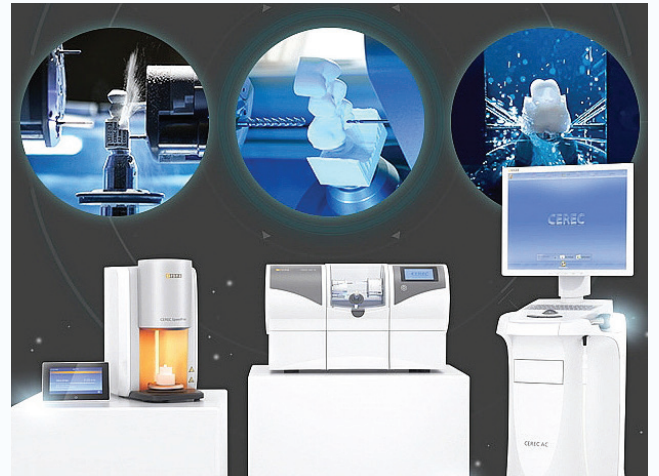
▲ ‘원데이 세렉 시스템’은 당일 치료와 동시에 보철물을 끼울 수 있는 시스템이다.

비절개 임플란트는 잇몸뼈를 노출시키는 과정 없이 잇몸에 작은 구멍을 내 인공치근을 심는 시술이다. 일반적인 임플란트에 비해 시술 시간이 짧고 잇몸 손상도 적어 통증과 출혈, 부기가 거의 발생하지 않는다. 또 시술 후 바로 일