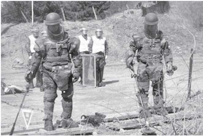
▲ 포천 육군 제6군단 예하 공병여단의 지뢰제거 훈련 모습

군사분계선(MDL) 남쪽에 있는 지뢰지대가 여의도 면적의 약 40배에 달하고 이 지뢰를 제거하려면 200년가량 걸릴 것으로 육군 관계자가 추정했다.