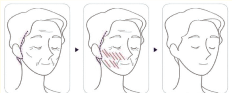
시술 전 탄력없는 피부 필자주름, 불살처짐, 피부처짐 등 부위에 실리프팅 삽입 시술직후 - 한달까지 리프팅 효과