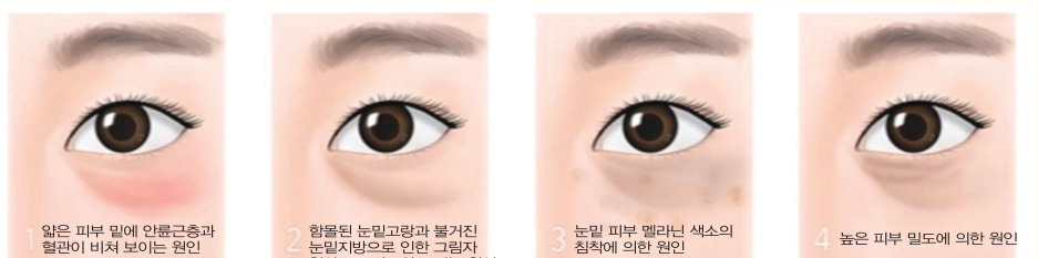
1 얇은 피부 밑에 안륜근층과 혈관이 비쳐 보이는 원인 2 함몰된 눈밑고랑과 볼거진 눈밑지방으로 인한 그림자 현상으로 어두워 보이는 원인 3 눈밑 피부 멜라닌 색소의 침착에 의한 원인 4 높은 피부 밀도에 의한 원인

“피곤해보이는 눈매 활력을 넣어주는 시술~” “피부가 얇아 탄력이 없고 눈가 주름이 심한경우”