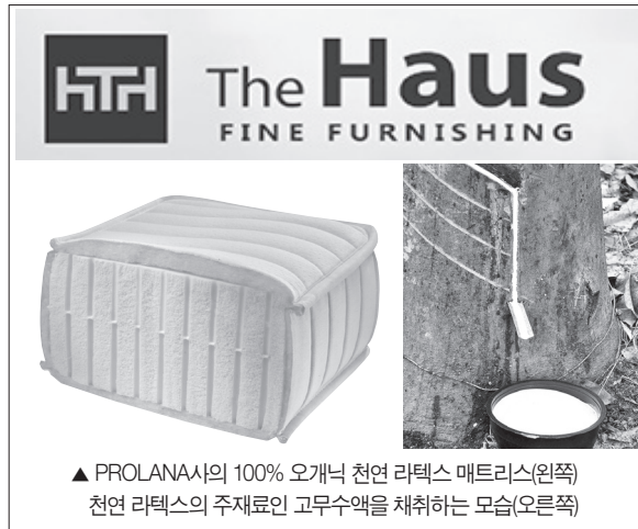
▲ PROLANA사의 100% 오가닉 천연 라텍스 매트리스(왼쪽) 천연 라텍스의 주재료인 고무수액을 채취하는 모습(오른쪽)

그에 따르면 100% 고무 수액으로 만든 라텍스 매트리스는 탄성이 좋아 전신을 고르게 받쳐준다. 또 통기성이 탁월해 사철 사용해도 언제나 편안함을 느끼게 한다. 천연 고무수액으로 만들어 합성 화학물질의 두려움에서 자유로울 수 있으며, 곰팡이와 집먼지진드기 등의 해충이 서식할 수 없어 피부질환, 비염, 천식, 알러지, 아토피로 고생하는 사람들에게 좋다. 라텍스를 일부 함유하고 있는 제품과 달리 100% 유기농 라텍스 매트리스에서 라텍스가 주는 편안함을 온전하게 느낄 수 있다. 또 요즘 한국에서 문제가 되고 있는 매트리스로 인한 공포에서도 자유로울 수 있다.