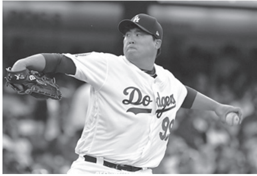
▲ 류현진은 105일 만의 복귀전에서 6이닝 동안 삼진 6개를 잡으며 3안타 무실점으로 완벽투구를 선보였다.

‘동아일보’에 따르면 류현진은 15일 다저스타디움에서 열린 샌프란시스코와의 경기에 선발 등판해 6이닝 동안 3안타만을 내주며 무실점 완벽 투구를 선보였다. 삼진을 6개 잡는 동안 사사구는 한 개도 내주지 않았다. 우타자 바깥쪽으로 떨어지는 낫차 큰 커브는 시즌 초보다 좋아졌다는 평가를 받았다.