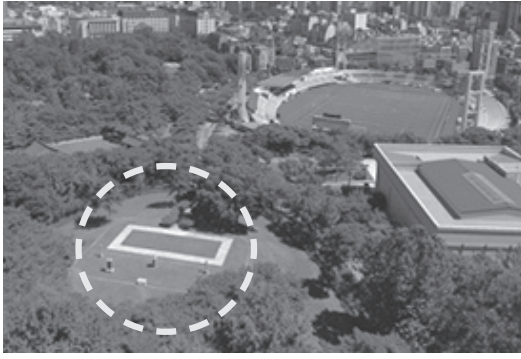
▲ 서울 용산구 효창공원의 모습. 백범 김구 묘역(좌선 안과 효창운동장(오른쪽 위)이 보인다.

서울 용산구 효창동 255번지 일대의 효창공원에는 김구 선생과 삼의사(이봉창·윤봉길·백정기) 묘소를 비롯한 안중근 의사의 가묘가 있다. 이동녕·차이석·조성환 선생 등 입정요인 묘역도 있다. 효창공원에 독립유공자 묘소가 들어서면서 1989년 사적 제330호로 지정됐다. 2005~2009년 독립공원화를 추진했으나 무산됐으며, 2007년과 2013년 일부 국회의원이 국립묘지 승격법안을 발의했으나 흐지부지됐다.