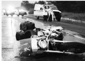
오토바이 사고 Motorcycle Accidents