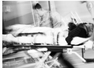
심각한 부상 Serious Injuries