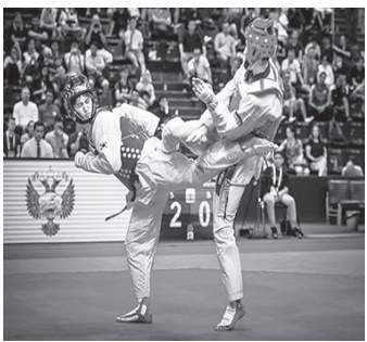
▲ 태권도 겨루기 종목

올림픽에서도 품새가 정식 종목으로 채택되는 것이 목표이기 때문에 이번 아시안게임에서 좋은 반응을 이끌어 내는 것이 중요하다. 관중석에서 싸늘한 반응이 나온다면 아시안게임에서도 정식 종목의 지위를 유지하기가 쉽지 않다. 태권도계에서는 두 선수가 맞붙어 격렬히 싸우는 겨루기 종목도 재미가 없다는 지적이 계속되는데 품새는 더 인기가 없지 않을까 하는 우려도 없지 않았다. 생소한 종목이다 보니 관중들은 채점 기준을 정확히 몰라 어떻게 승부의 향방이 갈리는지