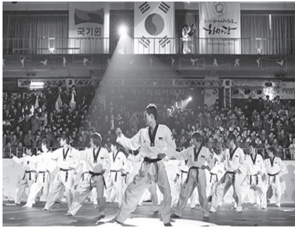
▲ 태권도 품새가 2018년 자카르타·팔렘방대회에서 아시안게임 정식 종목에 채택됐다. 사진은 국기원태권도 시범단의 품새 시범 모습

류병관 용인대 태권도학과 교수는 "흥행을 위해선 대중들에게 품새 채점 방식에 대해 홍보를 많이 해 종목 이해도를 높여야 한다."며 "힘의 절제와 표현에 집중해