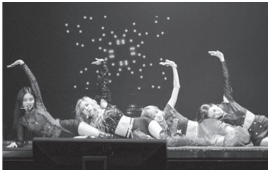
▲ 지난 24일 일본 오사카쥬 홀에서 공연하는 블랙핑크

아울러 블랙핑크는 전날부터 일본에서 ‘블랙핑크 아레나 투어 2018’에 돌입했다. 이들은 7월 24~25일 오사카쥬 홀을 시작으로 8월 16~17일 후쿠오카 국제센터, 8월 24~26일 미쿠하이 멧세 이벤트홀에