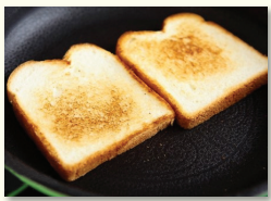
1. 식빵은 아무것도 두르지 않은 팬에 앞뒤로 노릇하게 굽는다.

※ 연유가 없다면 꿀이나 아가베시럽을 대신 넣어도 좋는데, 확실히 연유를 넣어야 더 맛이 좋아요. ※ 콩가루가 부족하다면 미숫가루를 섞어서 뿌려도 좋아요.