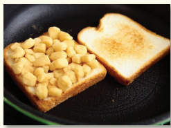
3. 버터가 녹으면 식빵 위에 말랑말랑한 인절미를 고루 올린다.