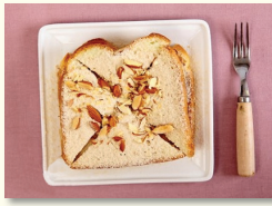
8. 그 위에 아몬드 슬라이스를 골고루 뿌려 주고 그릇에 담아 주면 끝.