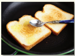
2. 구운 식빵 한쪽에 버터를 펴서 바른다.