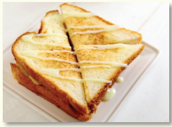
6. 다시 연유를 지그재그로 뿌려준다.