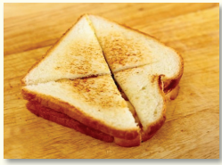
5. 인절미가 촉촉할 때 얼른 식빵 나머지 한장을 포개서 먹기 좋게 4등분한다.