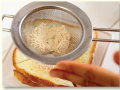
7. 토스트 위에 남은 인절미콩가루를 체에 넣고 고루 뿌려 준다.