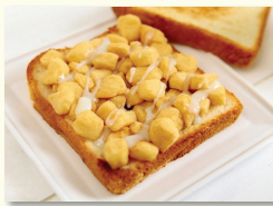
4. 전자레인지용 그릇으로 옮겨 연유를 지그재그 뿌리고, 전자레인지에 넣고 1분 정도 돌린다.