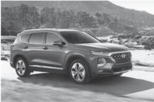
▲ 현대차가 새롭게 선보인 2019년형 싼타페

현대자동차가 미국에서 새 싼타페를 출시하며 판매 회복세에 탄력이 붙을 것으로 예상했다.