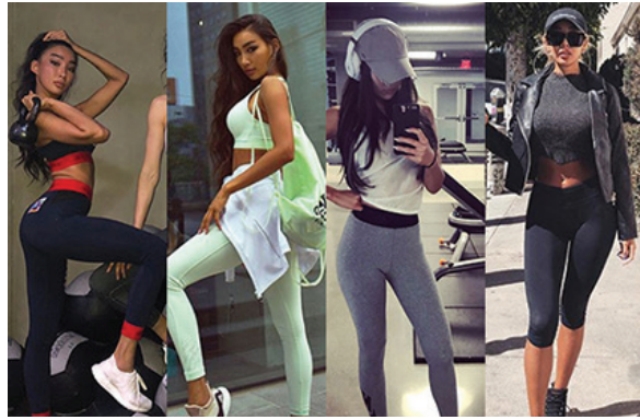
▲ 사진: 문가비, 효린, 제시 인스타그램

레깅스는 운동복 패션에서 빼놓을 수 없는 아이템이다. 피부 쓸림을 막고 활동성을 높여 운동을 더욱 효과