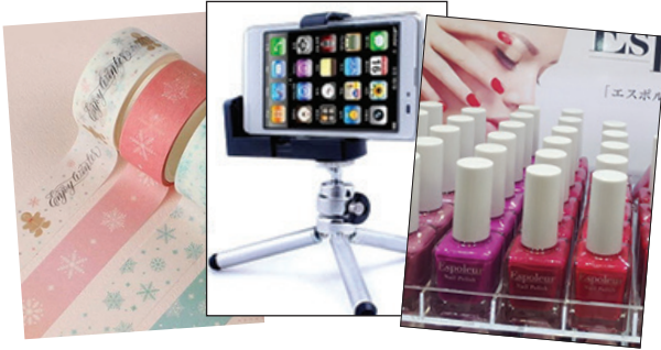
안전성이 보장되지 않았다는 의미이다.

자전거 앞, 뒤 바퀴에 설치하는 페그는 사람의 몸무게와 충격까지 200kg을 견뎌야 하는 부품이다. 가벼움을 위해 알루미늄을 사용하고 무게를 지탱하기 위해 강도가 높아야 하는데 다이소 제품은 알루미늄 소재의 등급이 제대로 표기되지 않았다고 한다.