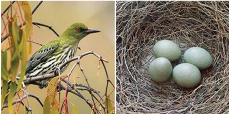
▲ 녹색등찌르레기와 녹색등찌르레기의 알(오른쪽 사진)