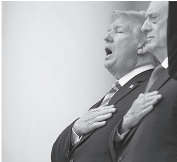
▲ 도널드 트럼프 대통령이 5월28일 버지니아 주 알링턴 국립묘지에서 열린 '메모리얼 데이' 기념식에 참석해 국기를 부르고 있다. 트럼프 대통령 옆은 제임스 매티스 국방장관.

트럼프 대통령은 이미 정치적 리스크가 따르는 결정을 한번 했다. 자신이 몸담았던 공화당이 반대하는 북·미 정상회담을 추진했기 때문이다. 북한에 강경 입장을 지켜온 공화당은 처음부터 김정은 북한 국무위원장과 의 만남에 대해 회의적이었다.