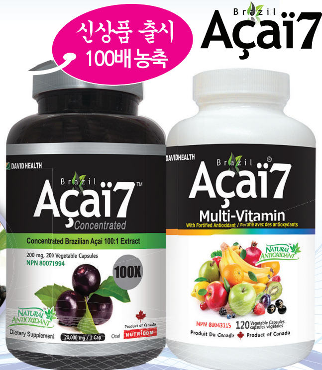
브라질아사이 100배 농축 200정 (하루 1알)