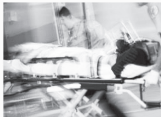
심각한 부상 Serious Injuries