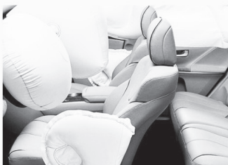
에어백 결함 Defective Airbags