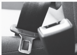
안전벨트 결함 Defective Seatbelts