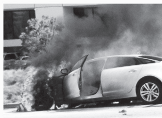
차량 화재 Car Fires