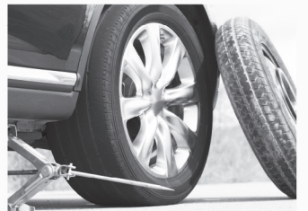
타이어 결함 Defective Tires