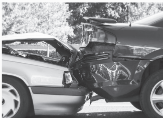
교통 사고 Auto Accidents

대기업들을 상대로한 수백만 달러 가치의 타이어 결함, 차량전복, 지붕파손 및 제품결함 책임관련 소송들을 성공적으로 이끌어냈습니다.