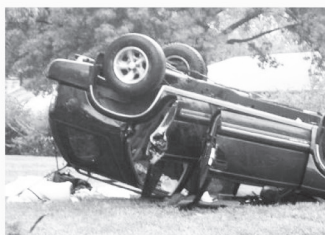
지붕파손 / 차량전복 Roof Crush / Roll Overs