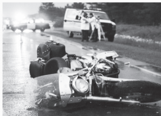
오토바이 사고 Motorcycle Accidents