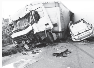
트럭 사고 Truck Accidents